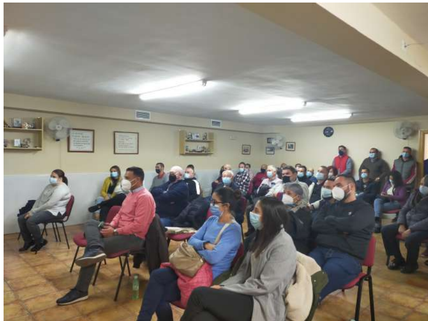
Pacientes que han finalizado el tratamiento en Amalajer