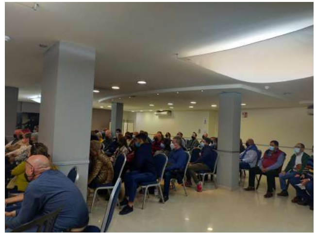
Momento en el aniversario de Amalajer

Las actividades han sido llevadas a cabo gracias al trabajo de las y los profesionales de la asociación y las personas voluntarias, pieza fundamental para el buen funcionamiento de la asociación, ya que estas personas son las encargadas de llevar la información a los distintos puntos de la ciudad y de ayudar en todas las actividades realizadas. Como venimos indicando todos los años, el punto fuerte de este proyecto es la calidad humana de las personas que componen Amalajer, ya que se ponen al servicio de la entidad, aportando su tiempo y buen hacer para poder llevar a cabo las actividades. De igual forma, los profesionales tienen una especial sensibilidad que permite flexibilidad en cuanto a tareas y horarios a la hora de trabajar.