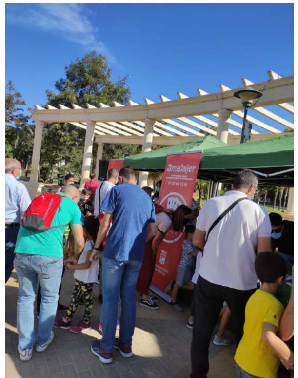
Celebración del Día sin Juego de Azar en el parque de Huelin