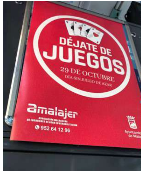
Carteles de Día sin juego de azar de Amalajer instalado en autobús de línea de EMT en Málaga