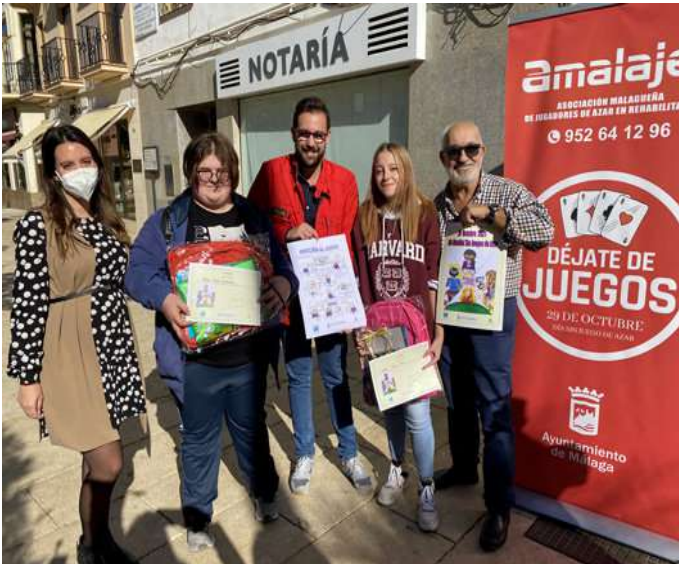
Plaza de las carmelitas en Vélez Málaga