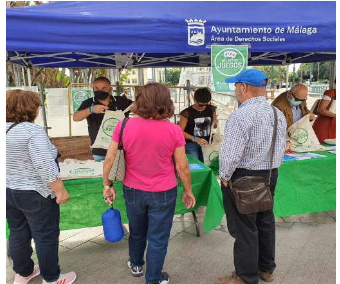
Plaza de la Marina