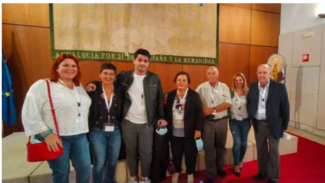
Representantes de Amalajer en el Parlamento Andaluz