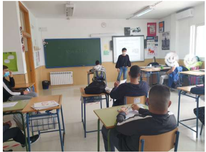
Momentos de las charlas en institutos de Carlinda y Fuengirola por parte de la psicóloga de Amalajer