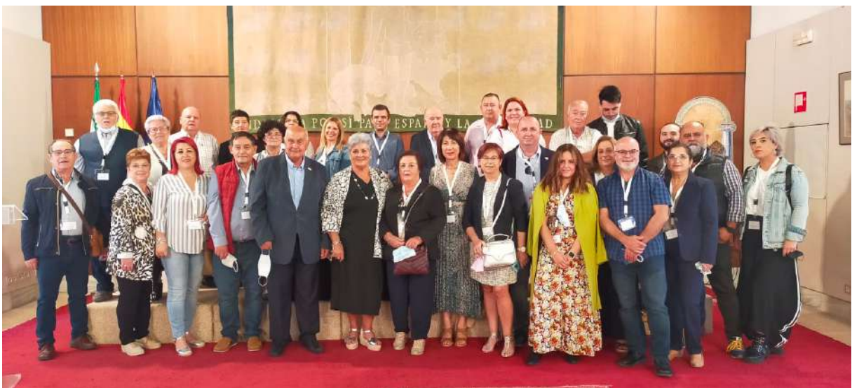
Asistentes a la presentación del Día sin Juego de Azar en el Parlamento Andaluz

El día 26 de octubre se realizó la presentación del día sin Juego de Azar por parte de Fajer en el Parlamento Andaluz, contando con representación de sus asociaciones federadas. Amalajer acudió con su presidente, psicóloga, trabajadora social, secretaria, monitores voluntarios y una familiar de un jugador en rehabilitación. La psicóloga de Amalajer, además, realizó la lectura del manifiesto contra los juegos de Azar.